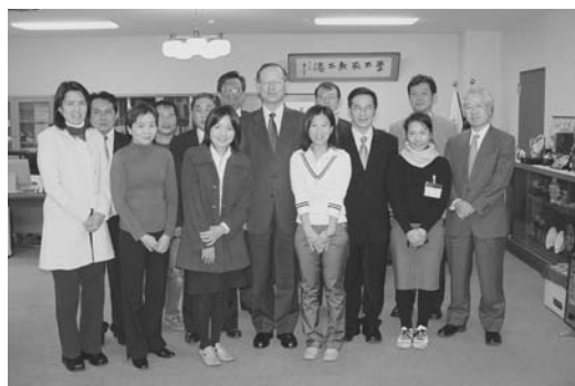
(懇談後の記念撮影)