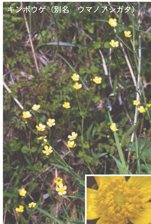
キンポウゲ（別名 ウマノアシガタ）