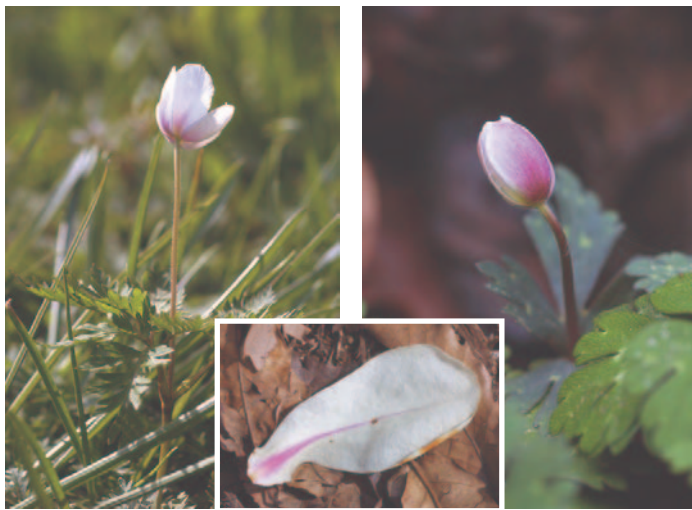
イチリンソウ コブシの花弁 ニリンソウ

春、F M多摩丘陵近隣に咲くキンポウゲ科の草本はアズマイチゲに始まり、ニリンソウ、イチリンソウ、ヒメウズ、ケキツネノボタン、キンポウゲなどです。この内イチリンソウ、ケキツネノボタン、キンポウゲがF M多摩丘陵内に生息しています。ニリンソウ、ヒメウズは、お隣の都立長沼公園には生息していますが、F M多摩丘陵内では見られません。