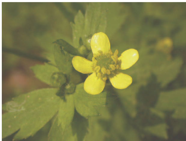
ケキツネノボタン

キンポウゲ科の草本は、どれも少し湿っているとこを好みます。これを逆に見て、キンポウゲ科の草本が生えていたら、その土壌はある程度湿度があると見ていいのでしょうか。