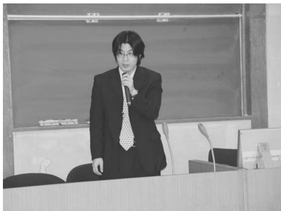
(伊 藤 氏)