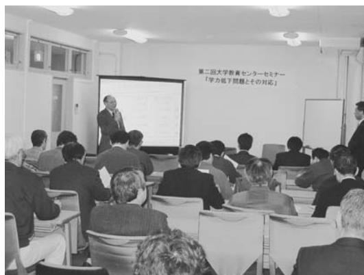
(第 2 回セミナーの様子)

両講演の後、参加した 34 名の教職員との間で質疑応答が熱心に行われました。アンケートからは、「大学で教育を変える切実な証拠が得られた」「大学の講義・実習にも参考になった」などの感想が寄せられました。