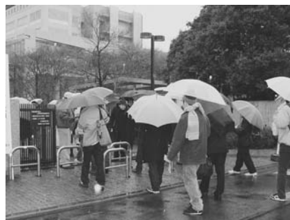
平成 17 年度大学入試センター試験受験状況