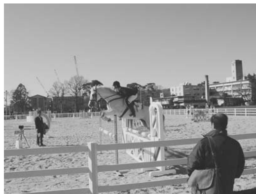
（障害飛越のデモンストレーション）