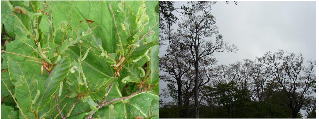
図1:ブナの葉を食べるハバチの幼虫(左:6月下旬の様子)とハバチが大発生した後の樹木の様子(右:7月上旬の様子)