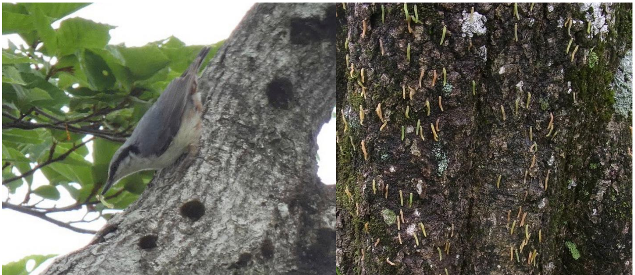
図3: ハバチを捕食するゴジュウカラ(左)と樹の幹を使って移動するハバチの幼虫(右)

一方、多くの鳥の種は必ずしもハバチの幼虫を効率的に採餌できなかつたり、営巣場所がハバチの大発生した場所の周辺に確保できなかつたりなどの理由により、ハバチが大発生しても数が増えなかつたと考えられます。