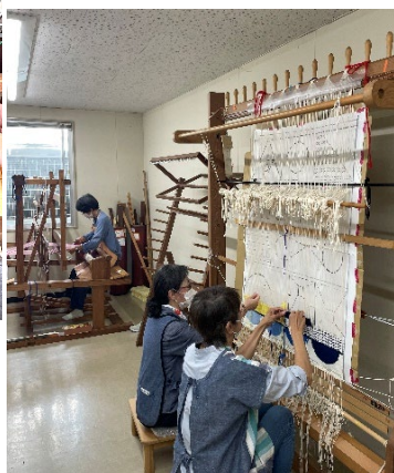
高機・堅機にて共同制作