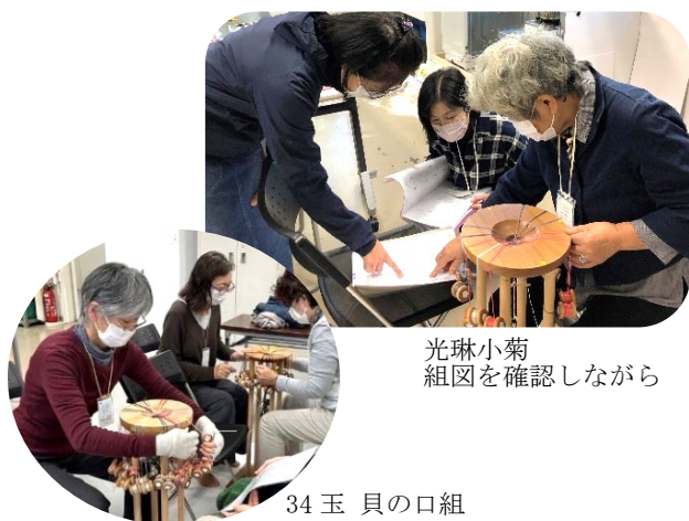
光琳小菊 組図を確認しながら