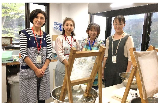
角真綿を作る1年生

私達は、先輩から引き継いだ「糸を大切に扱う心」と実習を通して学んだことを継承しています。日本の絹の伝統を絶やすことのないように、日々楽しく学び、活動しています。