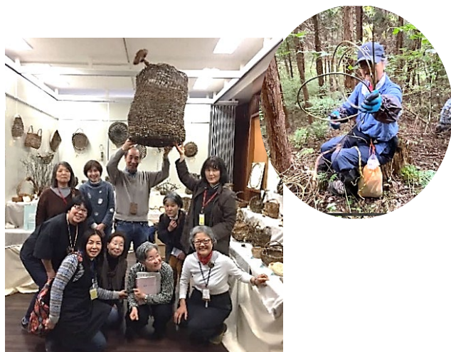
2020年第38回サークル作品展

オリジナリティ溢れる作品を見る事が一番の勉強になり、次の作品作りのステップになります。