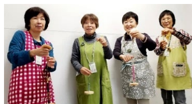
スピンドルで糸を紡ぐ1年生

作品展では、一年の成果である手紡ぎ糸はもちろん、その糸を使った編み物や織物を発表します。