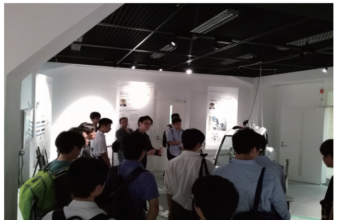
企画展のギャラリートークのようす