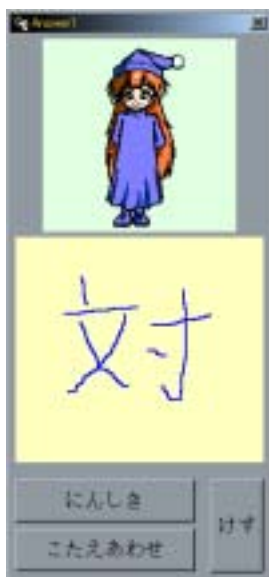
図 4 回答の入力例

回答者は(3)モザイク表示部に表示された漢字またはひらがなが何であるかが分かった段階で、(5)回答入力部に手書き文字で回答を書き入れます(図 4)。