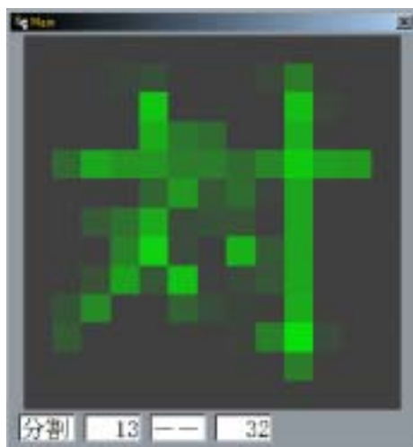
図 3 モザイク表示

出題者は、回答者の様子を見ながら(2)モザイク表示調整部を操作してモザイクの分割数を設定し、モザイクを詳細にしていきます(図3)。