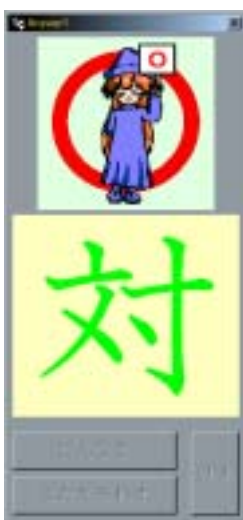
図 5 正誤表示

回答入力後(6)回答入力ボタンの中のにんしきボタンを押すと、手書き文字が認識され、その認識結果が(5)回答入力部に表示されます。認識結果が間違っている場合には、(5)回答入力部をタップすると、次の認識候補が表示されます。回答を書き直す場合には、けすボタンを押すと回答が消去されます。正しく認識された後に、こたえあわせボタンを押すと、回答の正誤が(7)正誤表示部に表示されます(図 5)。