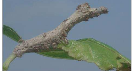
野蚕(クワコの)幼虫