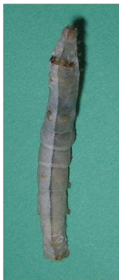
モザイク個体 左♀、右♂