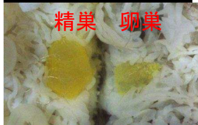
モザイク個体の生殖巣